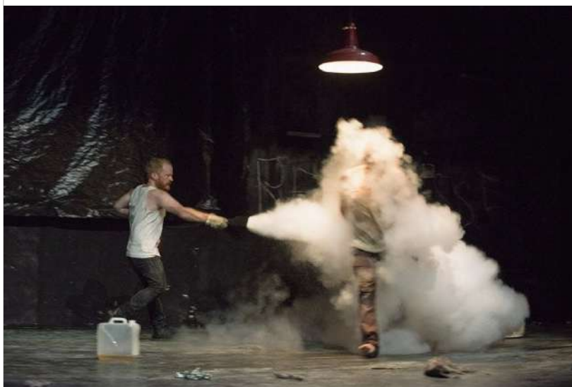
A ce projet personne ne s'opposait au Théâtre de la Colline.

Toujours séduisant et déroutant, la compagnie Théâtre à cru explore la possibilité d'inventer un nouveau modèle de société. Au croisement du politique et de l'écologique.